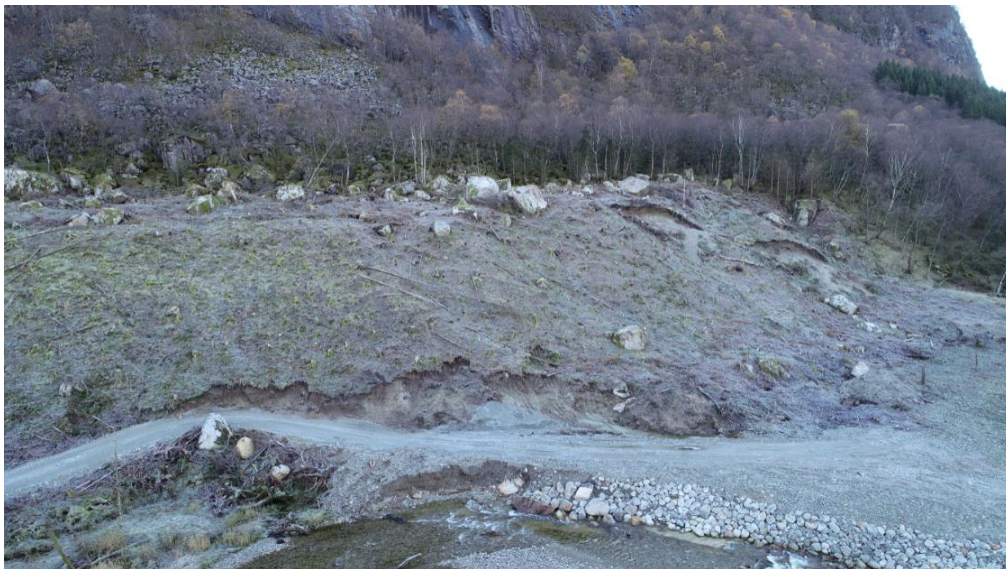
Figur 1 Gjenværende grusressurs inn mot Uburen

Det er nylig vedtatt en reguleringsplan for masseuttak på Fossanmoen/ Fossanåna. De aktuelle ressursene ble identifisert som et potensiale under arbeidet med planen, men lå i hovedsak utenfor det aktuelle planområdet, og det ble besluttet å avvente evt. regulering til etter vedtak av pågående planarbeid.