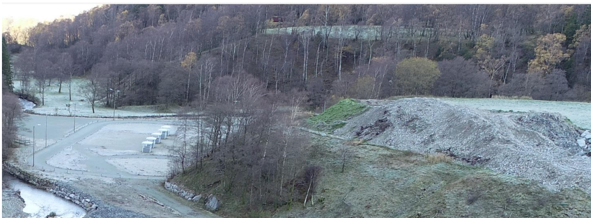
Figur 2 Kollen i bakre del av bildet, med grå flat bunn, er aktuell for uttak. Ridebanen til venstre i bildet.

Å legge til rette for uttak på disse eiendommene, vil også kunne bidra til å optimalisere rideanlegget i området, og samtidig en turveiforbindelse fra regulert turvei langs Fossanána og videre ned langs elva til Gnr. 41 Bnr. 6. Ved å forlenge turveien på denne strekningen vil en kunne oppnå en forbindelse helt ned mot landbruksvei på eiendom 41/6, som igjen går videre ned til sjøen.