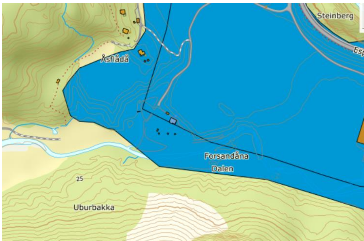
Figur 3 Kart viser nasjonalt viktige sandressurser. Kartet er grovmasket, og grensene for konkret sandressurs vil bli avklart i reguleringsarbeidet.

Det er avholdt møte og befaring med Forsand kommune, den 25.09.18.